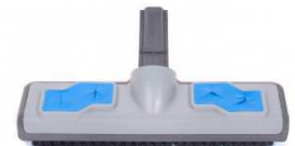
SP230: Raclette-brosse 20cm